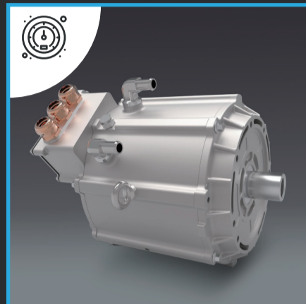
Potente Motor con 270 Nm de Torque.