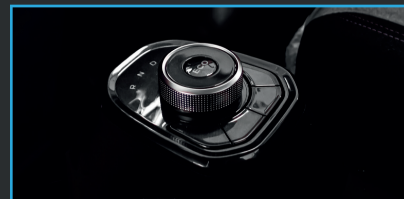
Moderna y cómoda cabina.