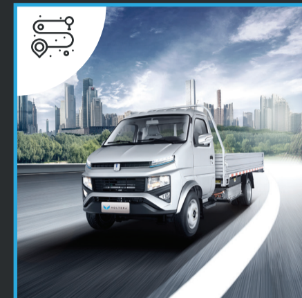
Autonomía real de 230 Km.